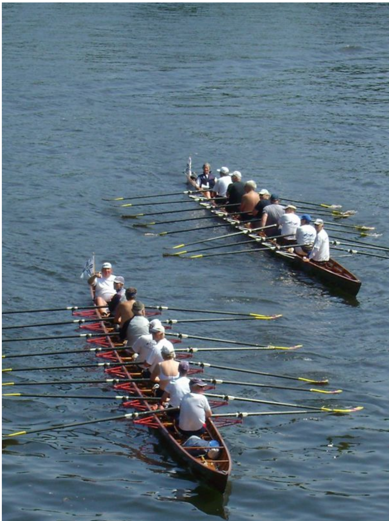
Imposantes Bild: Schweriner Ruderer unterwegs in Berlin.