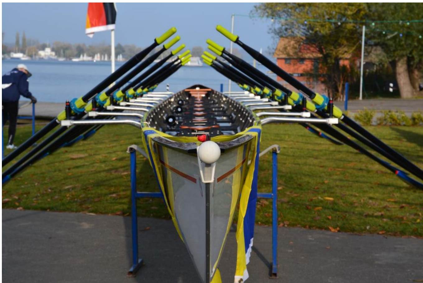
Der neue SRG-Achter.

Der neue Achter der Schweriner Rudergesellschaft (SRG) heißt „Schwerin“. Das wolkenweiße Gig-Boot ist eines von sechs Booten, das die Wassersportler beim Saisonabschluss am Sonnabend, 31. Oktober 2015, getauft haben.